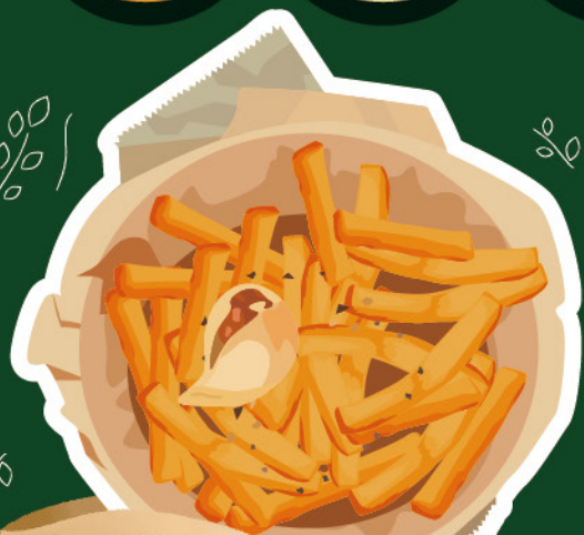
5種類のハーブポテト 500円