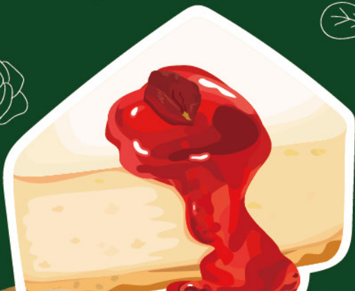
レアチーズの薔薇ジャムソースかけ 500円