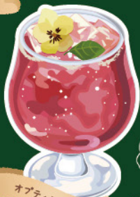
オプティミスト 100円

ヘーゼルナッツを贅沢に使用し、 アイシングの上にエディブル フラワーを飾りつけました。