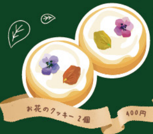
お花のクッキー 2個 400円

ヘーゼルナッツを贅沢に使用し、 アイシングの上にエディブル フラワーを飾りつけました。