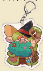
アクリルキーホルダー [全5種]各500円(税込)