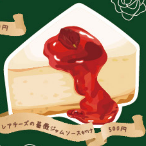
レアチーズの薔薇ジャムソースがけ 500円