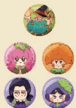
缶バッジ [全5種]各300円(税込)