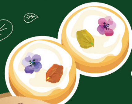
お花のクッキー 2個 400円

ヘーゼルナッツを贅沢に使用し、 アイシングの上にエディブルフラワーを飾りつけました。