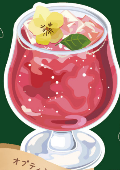
オプティミスト 100円

ヘーゼルナッツを贅沢に使用し、 アイシングの上にエディブルフラワーを飾りつけました。